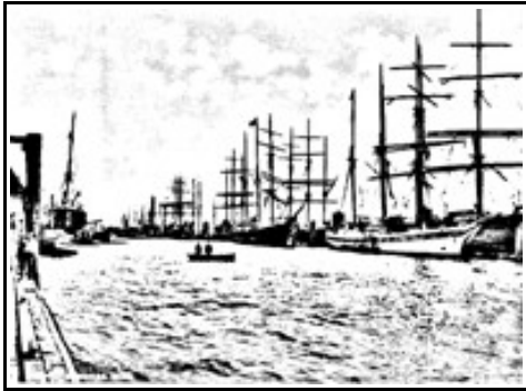
Der Hafen von Lost Angeles wenige Stunden vor dem Unglück.

In der Nacht vom 09. Juli explodierte aus anfangs unerklärlichen Gründen ein chinesisches Handelsschiff. Das Schiff war jedoch nicht mit explosivem Material beladen, es handelte sich um Stoffe und Gewürze. Zu dem Zeitpunkt der Explosion und dem Untergang des Schiffes befand sich ausserdem kein weiteres Schiff im Prosperity Bay von Lost Angeles, welches in Kanonenreichweite ankerte.